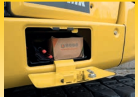
Großzügiger Stauraum unterhalb der Kabine