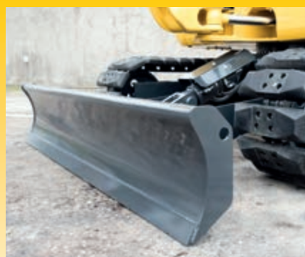
Neues, weiterentwickeltes Schilddesign