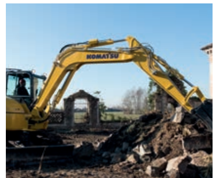
Sicherheitsventile an Ausleger und Stielzylinder