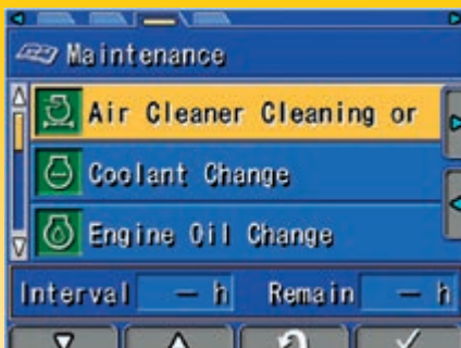
Das Multifunktionsmonitorsystem versorgt den Fahrer mit Wartungsinformationen.