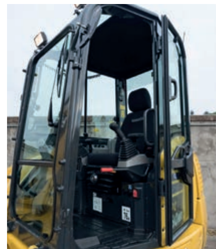
Neue klappbare Tür für besseren Zugang