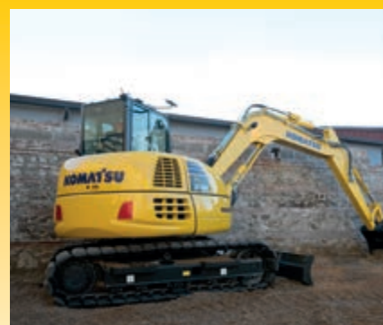
Kinderleichtes Grabenziehen dank reduziertem Frontschwenkradius und Auslegerschwenkfunktion