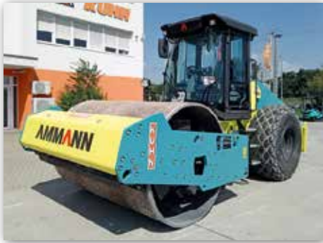
Ammann Walze ARS150 aufgerüstet mit ACE Force Compaction Measuring (Digitalisierte Dichtungsberichte für die Baustellen)

Wir wünschen der Familie Ács weiterhin viel Freude bei der Arbeit mit unseren Komatsu- und Ammann-Maschinen.