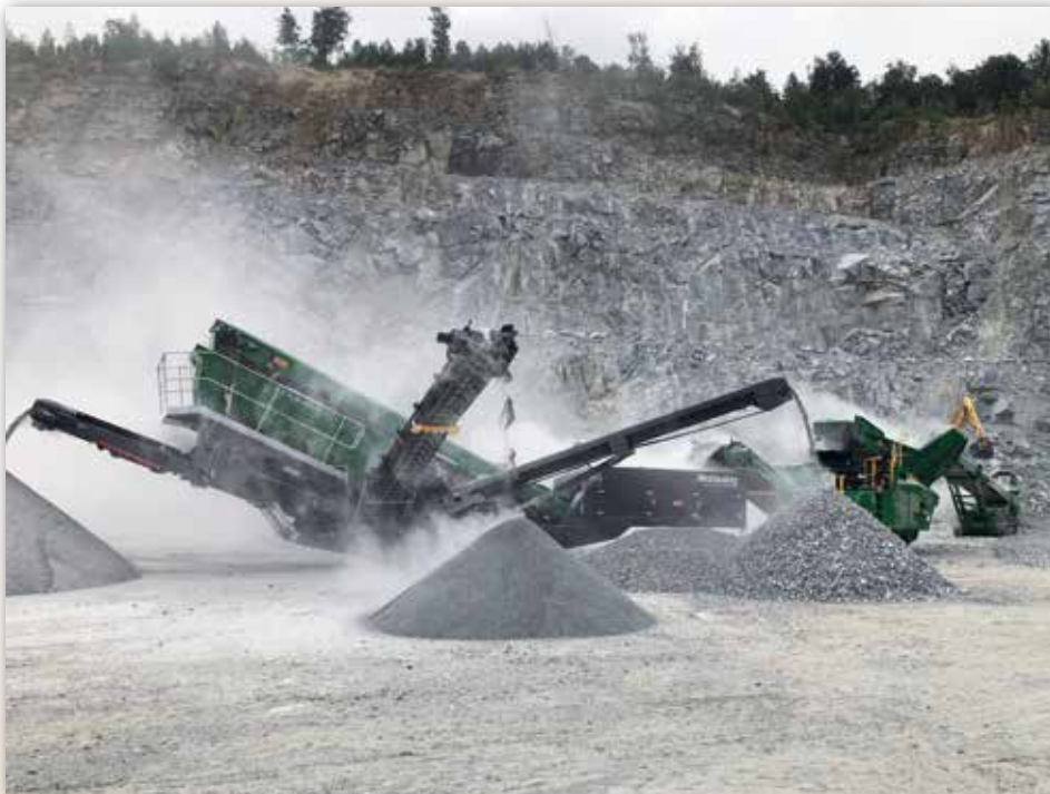
McCloskey Aufbereitungstechnik live erleben

Weiter gings dann am 12. und 13. Juli im Kieswerk Hammerl OHG. Auch hier waren die Spezialisten von Kuhn Baumaschinen vor Ort, um über einsatzspezifische Fragen zu beraten.