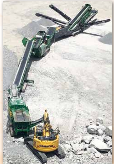
Eindrucksvolle Präsentation der McCloskey Aufbereitungstechnik