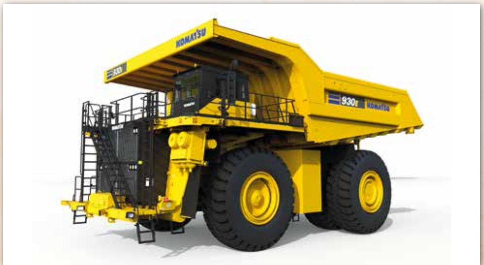
Der Komatsu 930E Muldenkipper, der zukünftig von Hydrotec-Brennstoffzellen angetrieben wird.

Diese Maschinen werden typischerweise über ihre gesamte Lebensdauer in einer einzigen Mine eingesetzt, was die Dimensionierung und Einrichtung einer Wasserstoff-Tankinfrastruktur für die Maschinenflotte vereinfacht. Der Wasserstoffbetrieb von Muldenkippern von Komatsu wird für die Dekarbonisierung eine Alternative zu mobilen Batterieladegeräten