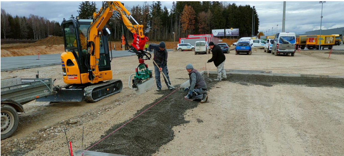
Der PC26MR-5 bietet noch mehr Leistung als die Vorgängermodelle und er verfügt auch über mehr Tragkraft.

Ein weiterer Vorteil des neuen Minibaggers ist durch seine einfache Bedienbarkeit gegeben. Ein neues Hydrauliksystem stellt eine hohe Leistung und Geschwindigkeit sowie die präzise Steuerung aller Bewegungen sicher. Dank der Kombination aus Verstellpumpe und dem neuen CLSS (Closed-centre Load Sensing System) Hydrauliksystem kann der Fahrer alle Bewegungen des Baggers unabhängig von der Last oder Motordrehzahl mit maximaler Effizienz steuern.