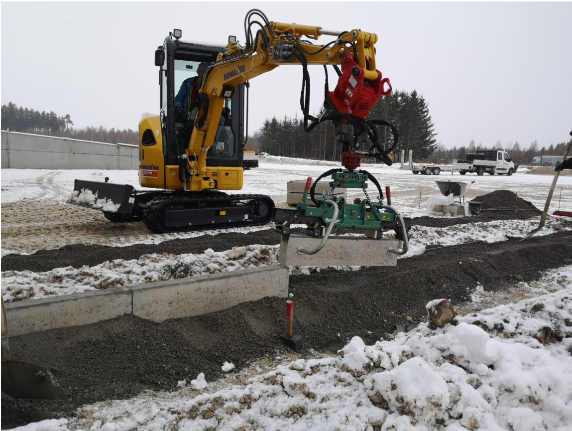
Der neue Kurzheckbagger ermöglicht auch höchste Leistungen auf engstem Raum.