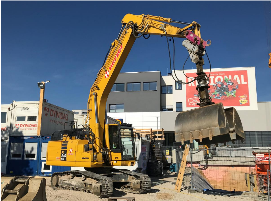
Der Komatsu-Bagger PC210NLC-11 ist leistungsfähig und spart zugleich Energie im Vergleich zu seinem Vorgängermodell.