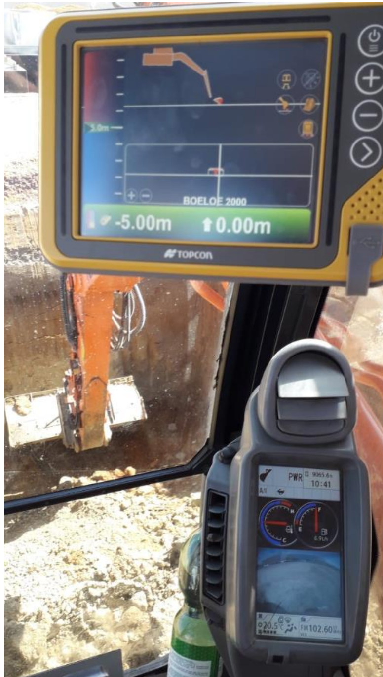
Die Firma Katzlberger hat die innovative 2D-Baggersteuerung X-52x von Topcon beim Baumaschinenhändler Kuhn erworben.