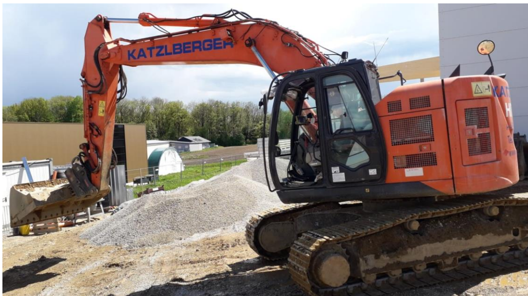
Die Topcon 2D-Baggersteuerung X-52x ist auf Baggern aller Marken einsetzbar.